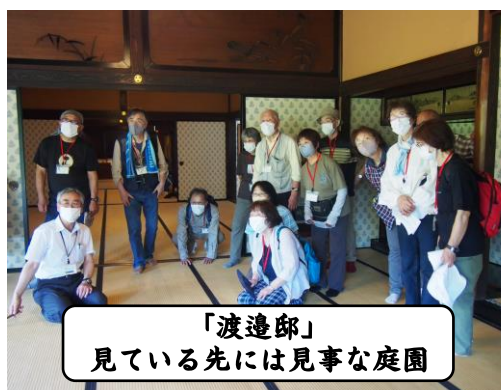
「渡邊邸」 見ている先には見事な庭園