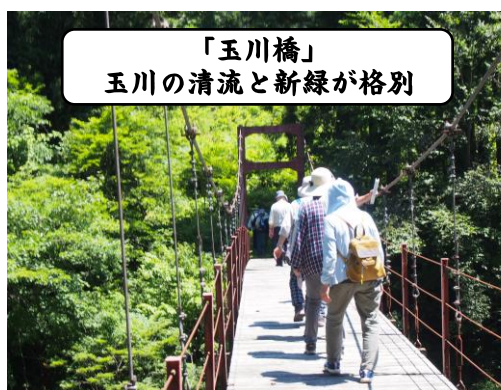
「玉川橋」 玉川の清流と新緑が格別