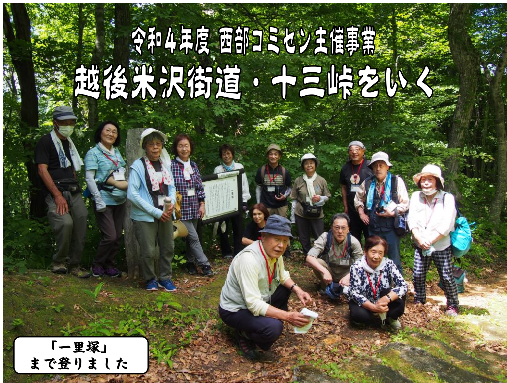
「一里塚」 まで登りました

発行；西部コミュニティセンター Tel.2 2-5 7 5 8 E-mail:seibu-co@ms5.omn.ne.jp