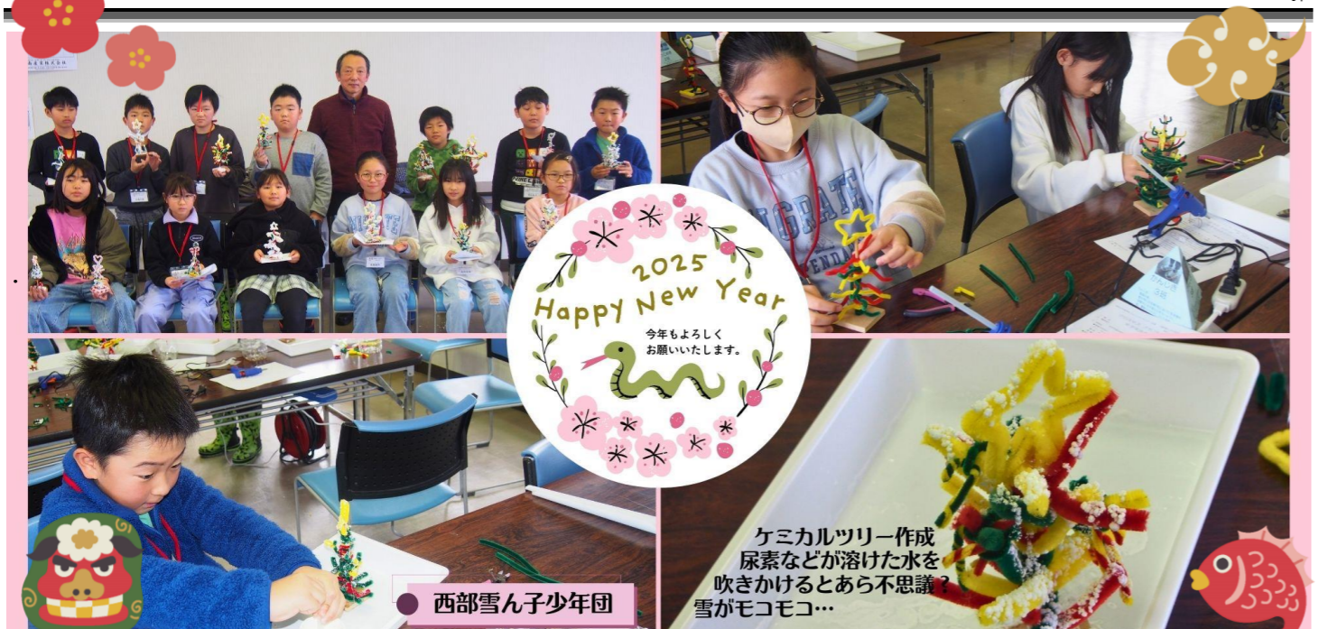
西部雪ん子少年団 ケミカルツリ作成 尿素などが溶けた水を吹かけるとあら不思議? 雪がモコモコ...

冬期間夜間の車両放置厳禁 夜間、コミセンの駐車場に車を置いていかれますと、翌朝の除雪作業の妨げになります。ご協力くださいますようお願い申し上げます。